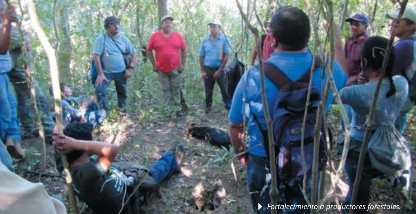
► Fortalecimiento a productores forestales.

Con todo ello se espera mejorar su competitividad, sus ingresos, incremento del mercado, capacitaciones, asistencia técnica, financiamiento y otras acciones que puedan generar progresos.