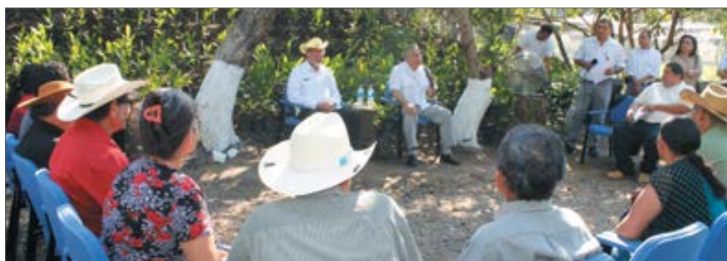
Ministro Orestes Ortez junto a productores Forestales.

Otro aspecto importante de destacar, es que el sector forestal nacional se encuentra desarticulado a lo largo de la cadena productiva, encontrando por un lado actores que demandan algunos tipos de maderas para diferentes usos, como artesanías, industria de muebles, la construcción y para usos energéticos y por otro lado, productores que no logran colocar en el mercado su mercancía, evidenciando la necesidad de enlazar la oferta y la demanda de los productos forestales.